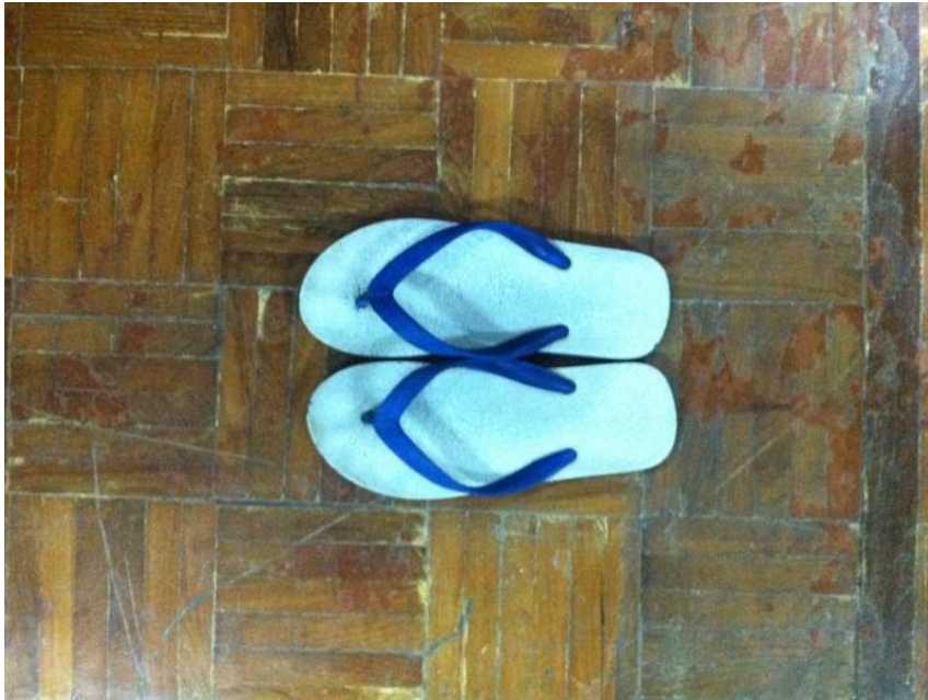
รองเท้าฟองน้ำชนิดหนีบ พื้นสีขาวหูสีน้ำเงิน