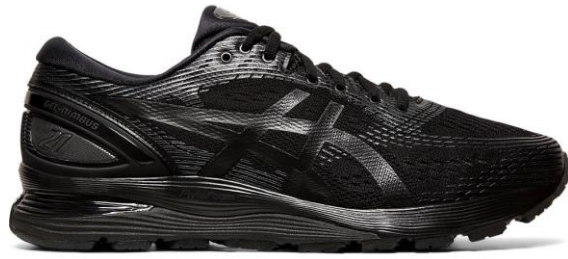
รองเท้ากีฬาสีดำ (สำหรับวิ่ง)